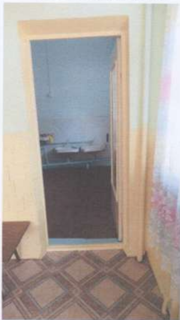
Фото № 15 (санузел группы)