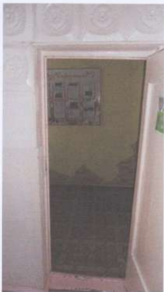
Фото №5 (вестибюль)